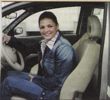
...ő hangulatfüggő, de türelmes vezető

– Hangulatfüggő, ha úgy adódik, komótosan is tu- dok menni, de a sportos, di- namikus vezetéssel sem ál- lok hadilábon. Utálok dugó- ban várakozni, és legalább ennyire dühít, ha ilyenkor valaki elém tolakszik. Nem vagyok sem átkozódó, sem mutogatós, sem dudálós fajta. Ha tehetem, odébb állok, magam mögött hagyva a kellemetlen szi- tuációt. V. Székely György