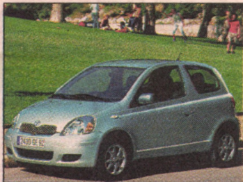
Évek óta töretlenül sikeres az európai piacon a Yaris

A Nissan a következő két évben 20 százalékkal kívánja növelni európai értékesítését, amely idén a tervek szerint eléri a 470 ezer darabot. A bővülést az autógyártás menedzsersztábjának tartott Carlos Ghosn vezérigazgató elsősorban az új Micrától várja, amelyet rendhagyó módon nem is otthon, Japánban, hanem az angliai Sunderlandben gyártanak. 16. oldal