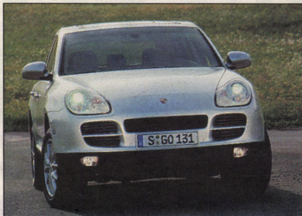
A vártnál nagyobb bevételt hozott az új Cayenne modell

A költségcsökkentést megelőzően átvilágították a beszállítókat, a termelést és a szervezett költségeit, különös tekintettel az új 911-es és Boxter modelle-