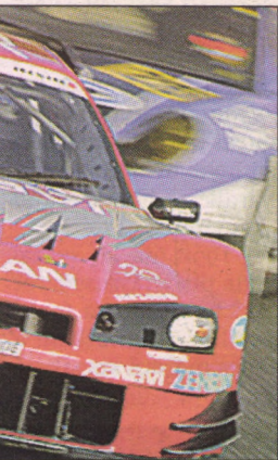
Bajnokságot a Nissan

A másik Skyline GT-R, a vezetett a versenyen, a 4. helyen végzett, ezzel a NISMO csapatra is sikerült meg a GT 500-as kategóriában a csapatok versenyt. A 350Z, a GT 300 kategóriában lett 2., és ezzel az eredménnyel szintén megnyerte a bajnokságot. (Metro)