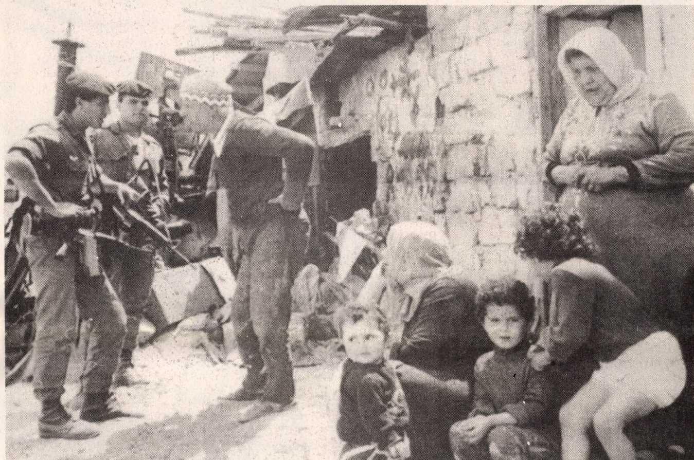
Ez a Gáza-vita 1988-ban zajlott. Most majd minden megváltozik?