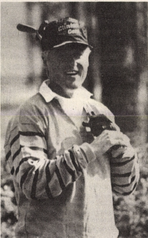
Hillarytól golfütőket kapott a születésnapjára

Az amerikai lakosság és az üzleti élet bizalmát Clintonék iránt jól mutatja, hogy novem-