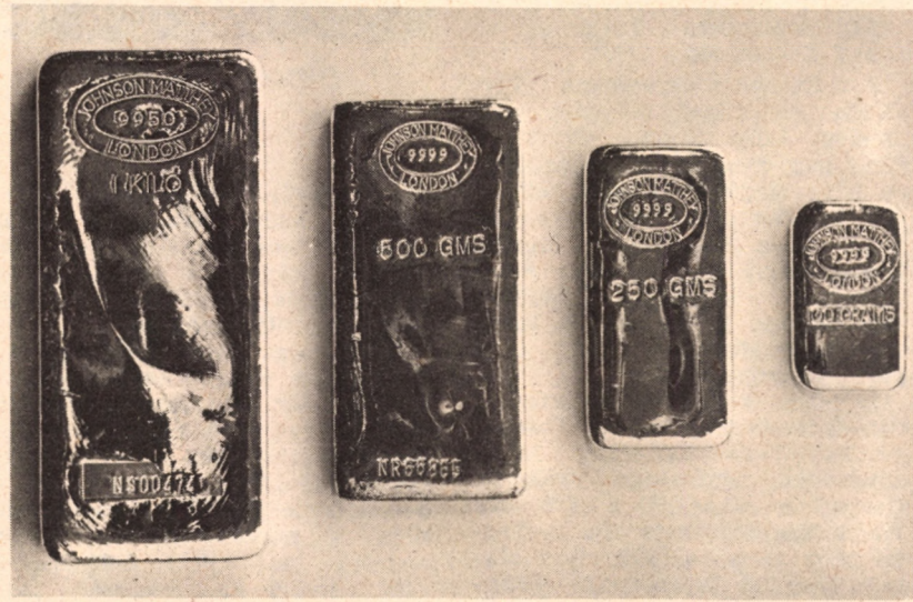
ANGOL ARANYRUDAK NAGYSÁGRENDEN

A második világháború utáni pénzügyi rendszer megteremtői mindenestre abból a hallgatóságos feltételezésből indultak ki, hogy az újonnan felszínre hozott arany mennyiség mind a hivatalos tartalékokat növeli majd. (Mint ahogy lényegében ez volt a helyzet 1931. és a háború vége között.) Az ékszerészet és a magánfelhalmozás hamar felnyomta az árakat, Közép-Keleten nemsokára már 55 dollárt adtak a fém unciájáért. Az IMF (Nemzetközi Valuta Alap) görcsösen igyekezett megvé-