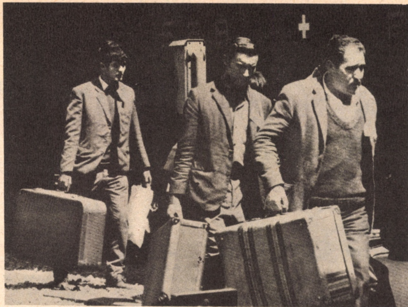
EGY SVÁJCI PÁLYAUDVARON

Nézzük a tényeket: az utóbbi évtizedben a Közös Piacon belüli munkásvándorlás évi 206 000-ről 167 000-re csökkent. Ugyanakkor a harmadik, tehát piacon kívüli országokból származó vendégmunkások száma 126 000-ről 692 000-re nőtt! (Összesen mintegy két és fél millió közösségen kívülről érkezett munkavállaló dolgozik ma a Közös Piac területén.)