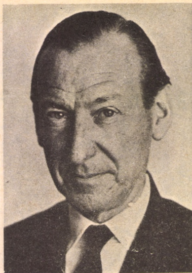
AZ ÚJ ENSZ-FŐTITKÁR Az alapokmány híres 99. cikkelye

Waldheim, aki hosszú időt töltött diplomáciai szolgálatban, 1971 tavaszán politikusi, államférfiúi képességekről is tanúságot tett. Ausztriában úgy értékelték, hogy ha nem is sikerült megszereznie a köztársasági elnöki posztot, mégis rendkívüli sikernek számít, hogy több mint kétfélmillió osztrák