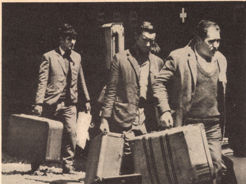
EGY SVÁJCI PÁLYAUDVARON

Nézzük a tényeket: az utóbbi évtizedben a Közös Piacon belüli munkásvándorlás évi 206 000-ről 167 000-re csökkent. Ugyanakkor a harmadik, tehát piacon kívüli országokból származó vendégmunkások száma 126 000-ről 692 000-re nőtt! (Összesen mintegy két és fél millió közösségen kívülről érkezett munkavállaló dolgozik ma a Közös Piac területén.)