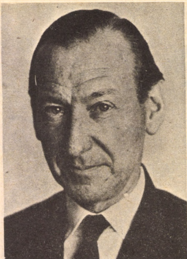
AZ ÚJ ENSZ-FŐTITKÁR