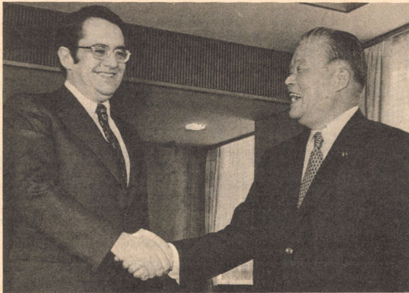
PETERSEN ÉS OHIRA TALÁLKOZÓJA

Az események Tokióban mély megdöbbenést keltettek. Mivel féltő volt, hogy a thaiföldi fejlemények más délkelet-ázsiai ország számára is példaként szolgálnak, befolyásos japán gazdasági szervezetek (a JETRO kereskedelemfejlesztési társaság és a Munkaügyi Minisztérium) azonnal szakértőket küldtek a helyszínre, hogy a megmozdulások hátterét kivizsgálják. A kiküldötteket Bangkokban újabb meglepetések érték.