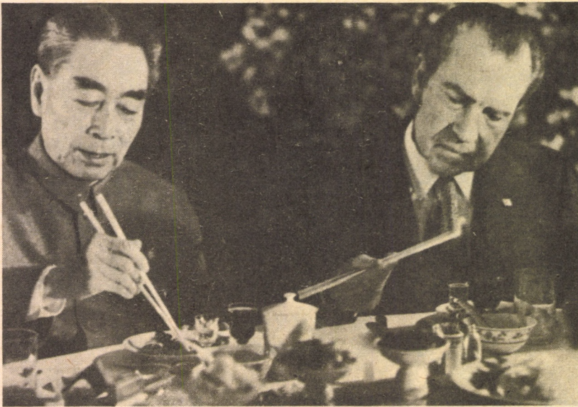
CSOU EN-LAJ ÉS RICHARD NIXON

„Még ha egy ország korábban ellenséges politikát is folytatott Kínával szemben, tárgyalni fogunk vele a kapcsolatok megjavítása érdekében, ha jelzi készségét e politika megváltoztatására. Rugalmas magatartást tanúsítunk, ami megengedhető és szükséges elveink érvényesítésében.” — (Pekingben)