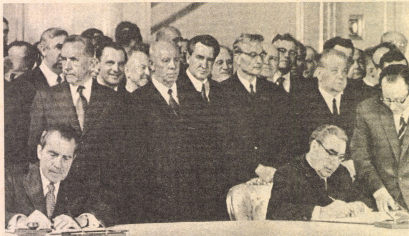
EGYEZMÉNYEK ALÁÍRÁSA MOSZKVÁBAN

Július 21—augusztus 1. Moszkvában megtartották a szovjet—amerikai kereskedelmi vegyes bizottság első ülését. A bizott-