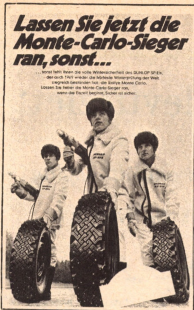
DUNLOP-HIRDETÉS Döntés Detroitban

sok viszont az USA-ban levő központ ellen persze már kevésbé tudnak hatékonyan fellépni. Adott esetben előfordulhat az is, hogy a helyi vezetés a cég könyveivel igazolja, a vállalat nem nyereséges, nincs miből bért emelni. (A világkorszernek leányvállalatai egymás közötti szállításaik hamis értéken való elszámolásával tetszés szerint tehetik a lánc bármelyik tagját nyereségesé vagy veszteségesé. Így könnyen át is lehet menekíteni a profitot egy olyan országba, ahol alacsonyabbak az adók.)