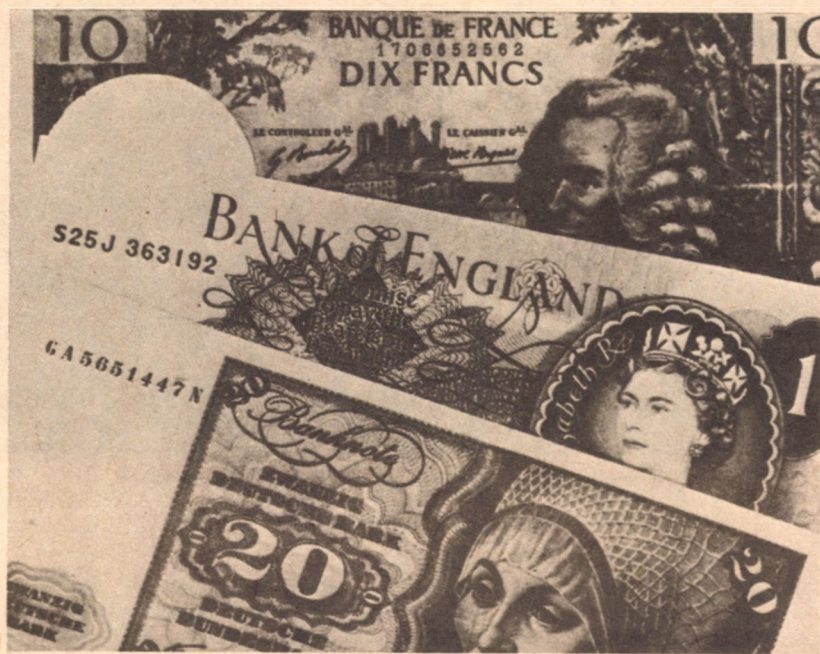
HÁRMAN A FŐSZEREPLŐK KÖZÜL: FRANK, FONT, MÁRKA

Japán: az 1971-es felértékelést a japán kiviteli áraiba már előre beszámította, a legtöbb esetben nem nyúlt áremeléshez, inkább a haszonkulcs csökkentését határozta el. Ez alkalommal nem biztos, hogy ilyen megoldásra lehetőség van. A jen 15-20%-os felértékelődése (10% az aranyáremelés, 5-10% a lebegtetés) a textilipart komolyan érinti. (Az ok Tajvan, Dél-Korea és Hongkong termékeinek világpiaci versenye.) Szenveteni fog a hajóépítő-ipar is, amely hosszú lejáratú szerződéseit dollárban kötötte és a szinesfémipar meg a gépgyártás is. Önmagában azonban a leértékelés nem oldja meg a hatalmas japán kereskedelmi többlet problémáját. Ha az amerikai piacról kiszorulnak, egyes exportra termelő iparágak a nyugat-európai piacot fogják