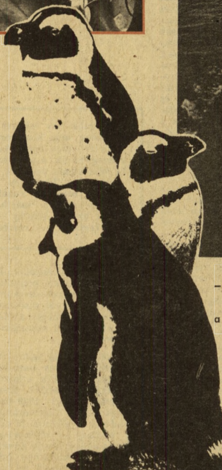
– Az utasok egy része rövid kirándulásra indul a „Vize professzor”-ról

A születésnap reggel kezdődött, a vadonatúj zászló ünnepélyes felvonásával. Ezt követte a hajón születésétől fogva dolgozó tengerészek, és tudományos dolgozók megjutalmazása. Ebéd után újabb ünnepség a fedélzeten. Ekkor osztotta ki a kapitány a „keresztlevelet”, a cikornyás betűkkel megírt, színes nagy diplomát, amely örökre igazolja az Egyenlítőn való átkelést. Itt mutatták be azt a csodálatosan szép fafa-ragaszt, majdnem 1 négyzetméteres könyvet, amelynek falemez lapjai egyike-re az út tiszteletére írt verset vésék fel cikornyás betűkkel, a másik oldalon pedig a hajó utasainak aláírása, színtér fába vésvé. Ezzel azonban még nem ért véget a születésnap. Este műkedvelő koncert volt, a hajón alakult amatőr beatzenekarral és a 250 ember között szép számmal rejtőző tehetségek fellépésével. Az Egyenlítő tájékán derült ki, hogy egy bridzs-klub megalakulásához is megfelelő számú bridzsöst visz a hajó. Mondanom sem kell, a klub percek alatt megalakult. Titkára egy szovjet és az egyetlen magyar kutató lett. Lengyelországban elterjedt játék a bridzs, a bolgár kolléga világsvargásáiból ismeri, a szovjet geofizikus pedig a legmegfelelőbb helyen (egy hosszú telet töltött az egyik angol antarktisi kutatóállomáson) szerezte tudományát. A legérdekesebb talán a játék nyelve volt, amely angol–francia–ma-