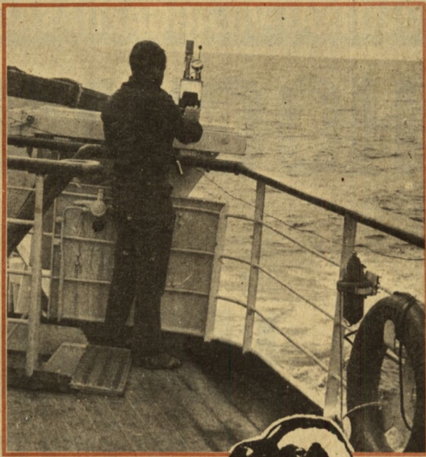
– Prognózist mindennap készíteni kellett

„Vize professzor”-nak 5. születésnapját. És itt elnézést kell kérnem az olvasótól. Az előző írásaim egyikében adott információ téves volt. A „Vize professzor” nem 2, hanem 5 éve készült el, és nem a rostóczi, hanem az NDK-nak egy másik, a vismári hajógyárában. Az Egyenlítő tiszteletére rendezett Neptun-ünnep annyi érdekességet, vidám epizódot eredményezett, hogy erről később, hazatérésem után külön írok.