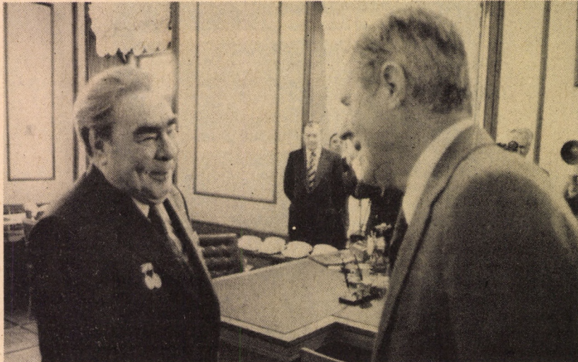
LEONYID BREZSNYEV FOGADTA CYRUS VANCE-ET Több történt a korábban már ismert álláspontok kifejtésénél

Gromiko szovjet külügyminiszter összesen négy alkalommal, együttvéve csaknem 12 órát tárgyalt amerikai kollégájával s ennek az időnek nagy részét valóban a SALT-megállapodás kérdései vették igénybe. Ugyancsak ez a téma dominált azon a megbeszélésen is, amelyet Leonid Brezsnyev folytatott Cyrus Vance-szel. Természetesen szó volt a két ország kapcsolatainak egyéb összefüggéseiről, a leszerelés kérdéseiről általában, néhány más nemzetközi kérdésről, így a Közel-Kelet és Afrika problémáiról, szemmel látható volt azonban, hogy mindkét részről a kulcsfontosságú SALT-téma ügyét tekintik az elsődlegesnek,