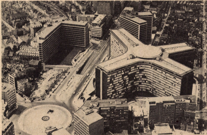
LÉGI FELVÉTEL: A BRÜSSZELI KÖZÖS PIACI FŐHADISZÁLLÁS

A spanyol belépés által felvetett problémák listáján Párizsban az is szerepel, hogy az országban alapított vállalataik révén a csatlakozás előnyeiből az amerikai és japán multinacionális vállalatok is részesülnek majd, a tagsági kérelem tehát a tengerentúli versenytársak „trójai falovának” bizonyul majd. A felmerült kérdések bonyolultságának a spanyolok is tudatában voltak, gyors döntést