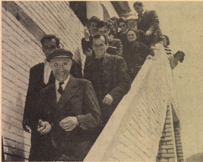
MEHMET SHEHU ALBÁN MINISZTERELNÖK MOGLICA FALUBAN

Albániában ma aligha érdem a rokonszenv hangjáról beszélni a kínai párttól. annak ideológiájáról, külpolitikai doktrínájáról.