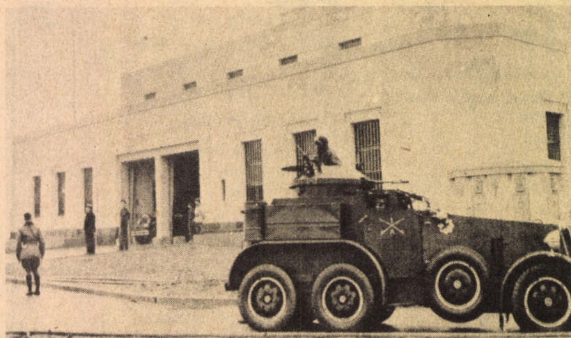
PANCELOZOTT JARMŰ A KÖZPONTI ÉPÜLET ELŐTT

Természetesen felmerülhet az a kérdés is: vajon valóban tömör acél- vagy vasfalról van-e szó? Egyértelmű igennel lehet válaszolni, hiszen ezen a falon a központi aranyraktárba vezető ajtó súlya 30 tonna. Amennyiben nem tömör acélfalról lenne szó, nem bírná el ezt a hatalmas terhet. Ugyancsak a tömör verzió mellett szól, hogy a helyiség teteje csaknem négy méter vastag — háromszorosan védett a bombatá-