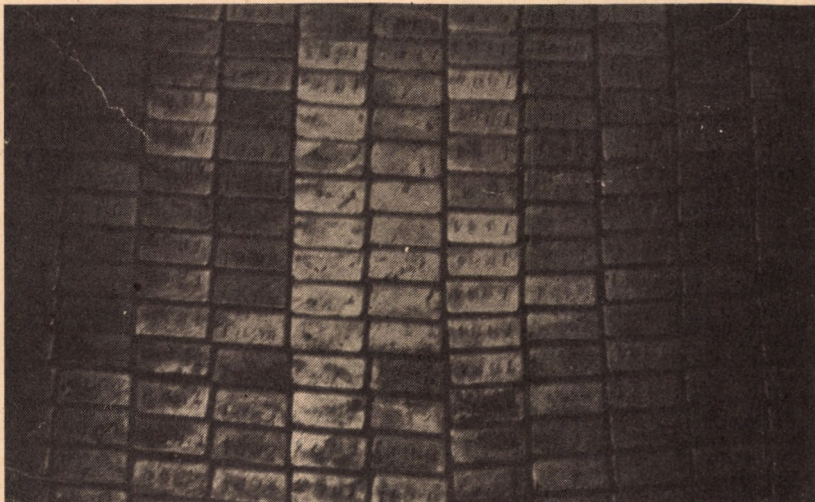
ARANYRUDAK FORT KNOXBAN 50 tonnás acéltömb állja útját

Fort Knoxban, az amerikai aranytartalék megőrzési helyén, a központi épületen nem leng mindig a sávos-csillagos zászló: csak akkor látható, ha a rendkívülien őrzött „bunker” ajtaját kinyitották, s a kamrából aranyat szállítanak el — vagy na éppen új tömbök érkeznek. A zászlót automatika irányítja: a 30 tonnás ajtó nyitáskor indul a magasba. (Az utóbbi időben igen nagy volt a mozgás Fort Knoxban, s ebben szerepet játszott a dollár körül kialakult, stabilnak egyáltalán nem nevezhető helyzet. A hamburgi Der Spiegel szerint egyébként a Fort Knoxban őrzött amerikai arany mennyisége 1971-ben, egy év alatt több mint 3 milliárd dollárral csökkent, ez volt az erődítmény életében a legnagyobb „aranyvérvesztés”).