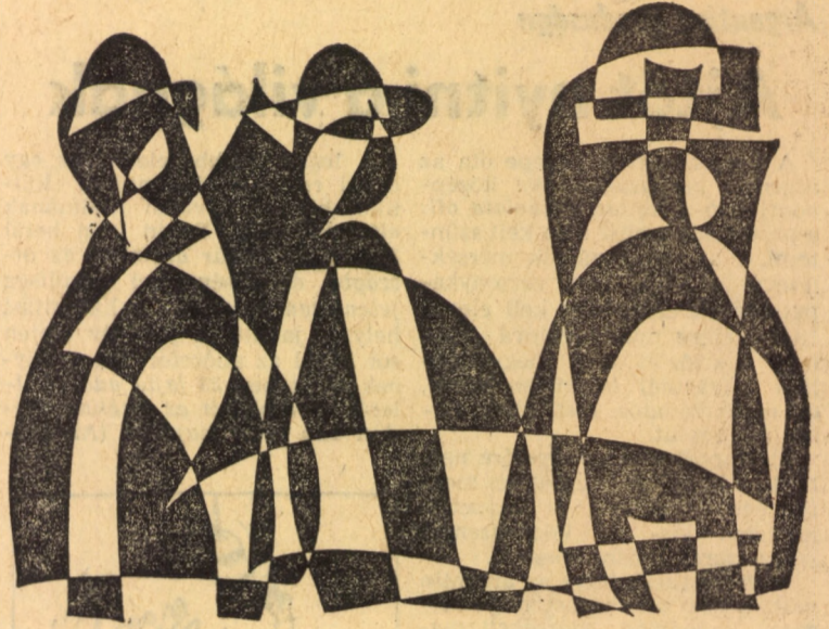
Szász Károly István rajza