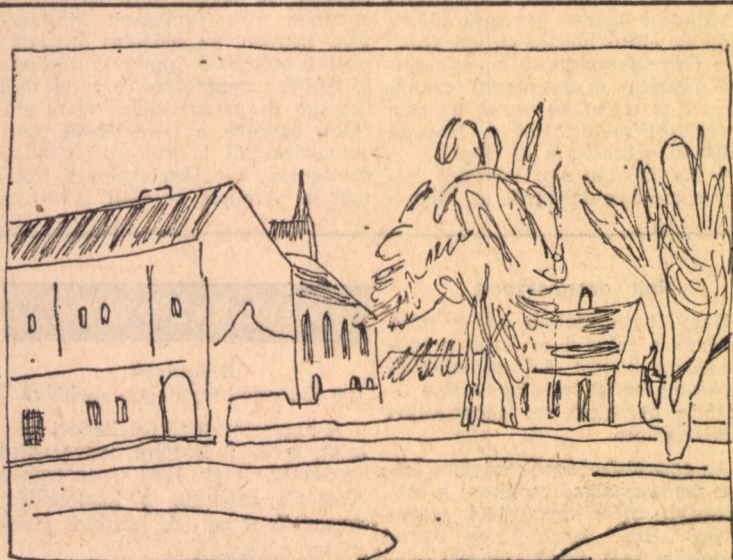
Stark Anng rajza

Szeptembertől júniusig keddsütőtörtökönként, havonta átlag 9 alkalommal látogathatók a Planetárium kupolájában modern eszközzel szemléltetett előadások.