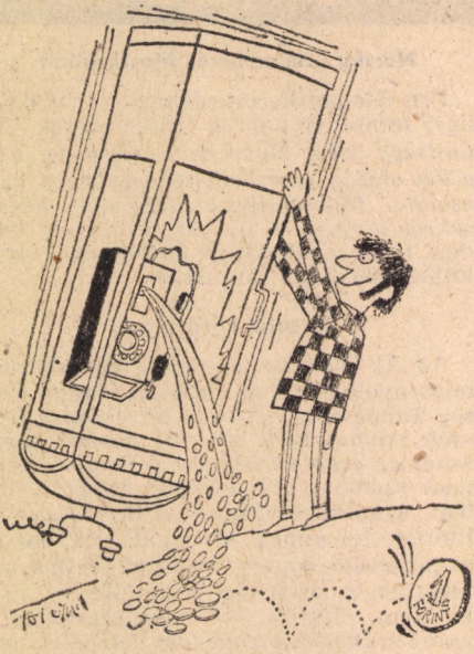
(Tót Gyula karikatúrája)