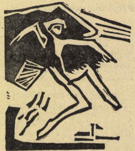
Swierkiewicz Róbert metszete

SÓLYOM: A KISZ elvileg nem zárkózik el a támogatástól. VIT-delegációkban máris vannak ilyen együttesek, s a jövőre rendezendő országos diáknapokon önálló kategóriáknak írjuk ki ezeket a műfajokat. Amennyiben a zenével foglalkozó szakmai szervek létrehozhatnak megfelelő élővonalbeli együtteseket a már meglévő mellé, és valamelyest kialakulnak egy tömegmozgalom körvonalai, szí-