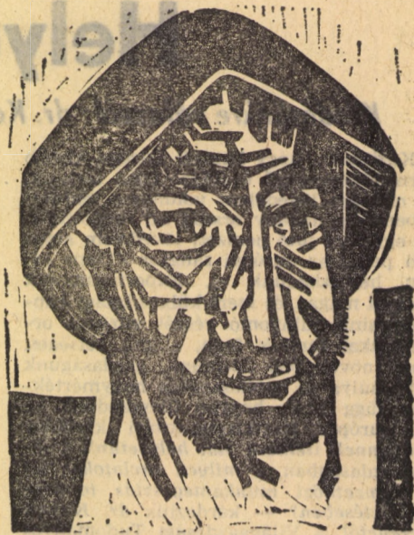
Gábor Emil metszete