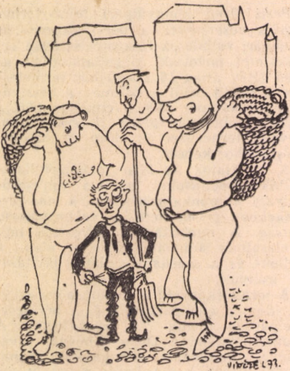
(Vincze Lajos rajza)