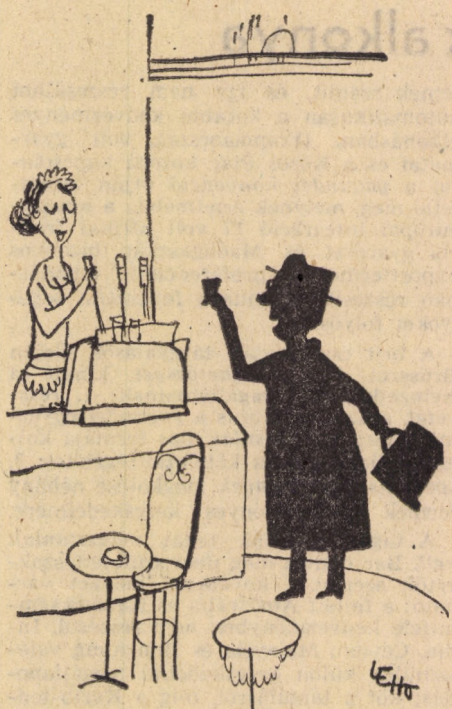
(Lehoczki István karikatúrája)