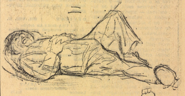
Bertalan Tivadar rajza