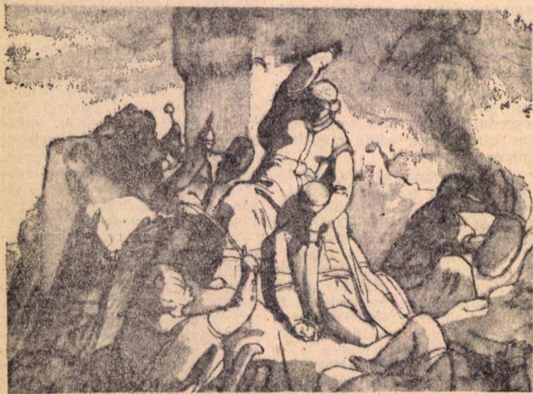
Székely Bertalan: Az egri nők (vázlatváltozat, 1861)

lehajtott fejjel ülő, kezét az asztalon nyugtató borzas hajú férfi... ez nem lehet véletlen, sem tévedés: ez a két alak Munkácsy Mihály nagy erejű festményének, a Siralomház nak a két fő alakja.