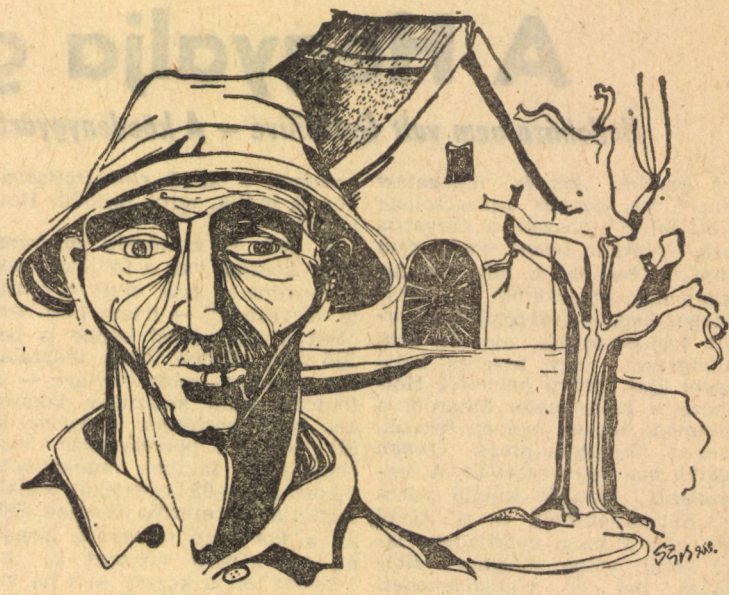
Szunyogh Ferenc rajza