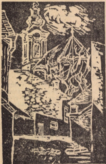
Szánthó Imre metszete