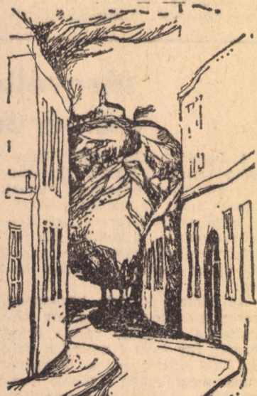
Szunyogh Ferenc rajza