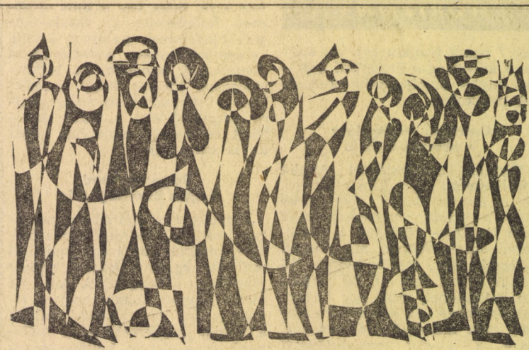
Szász Károly Isván rajza