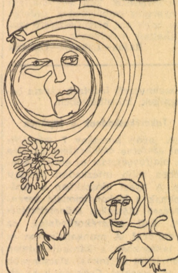
Kertész László rajza