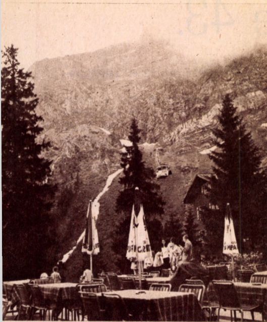
Turistaszálló a Luzern melletti 2120 méter magas Pilátushegy lábánál

1968-ban létrehozta idegenforgalmi szakosztályát, a MALEV Air Tours-t, amely önálló utazási irodaként működik. Repülőúttal egybekötött magyarországi programokat szervez és bonyolít le csoportok számára, menetrendszerinti és bérelt különjáratokon.