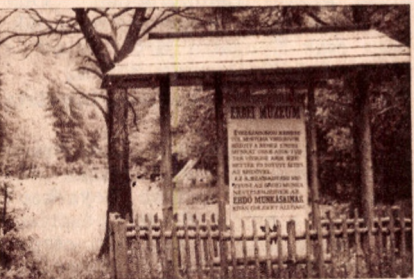
A szilvásvárad Erdőműzeum