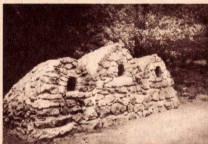
XVIII. századbéli üveghuta Szilvásváradról