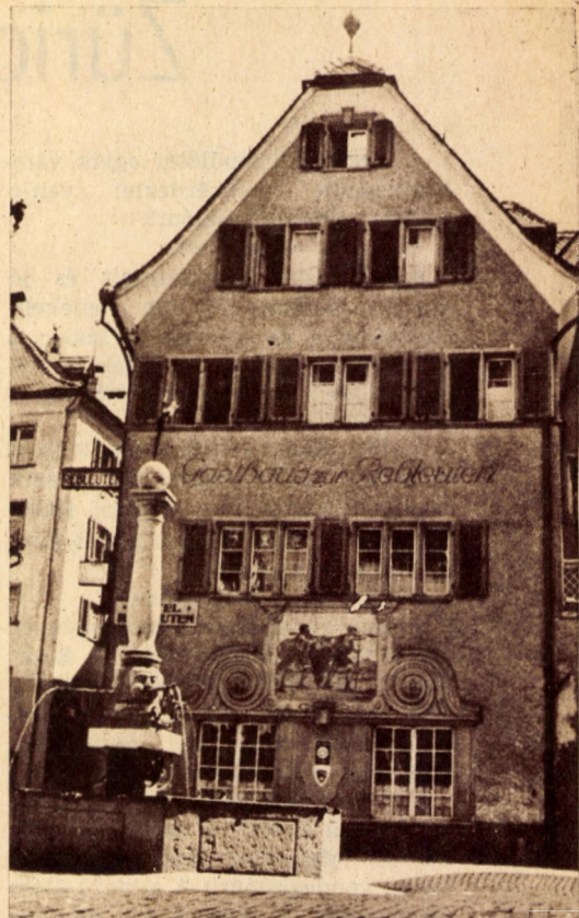
250 éves vendégfogadó Chur-ban

Séta közben összeakadtunk egy szikár férfiúval, aki koromfekete, csupabozont, igazi magyar pulit vezetett maga mellett. Kísérőm elég hangosan jegyezte meg: „Nézd, olyan mint egy kis pamacs.” Ebben a pillanatban a puli kitépte magát pórázrt tartó gazdája kezéből, odarohant hozzánk és boldogan ugrálni, csaholni kezdett. A gazdi pedig méltatlankodva kiabált: „Pamax! Pamax!” A puli rá se hederített. (Úgy látszik szívesebben hallgatott az „anyanyelvére”). Később mégis összebarátkoztunk, sőt meghívtuk a megengesztelődött kutya-tulajdonost egy feketére. Pamacsot pedig egy fagylaltra. A cukrászda pultján ismerős süteményt fedeztem fel, kis árjelző céduláján ott állt a neve is: Hans Rigo. Pamax