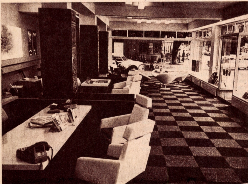
A MALÉV zürichi kirendeltségének irodája

A MALÉV — ezt is megírták a svájci lapok — különös gondot fordít a repülős turisztika fejlesztésére. Mind jobban bővíti kapcsolatait az utazási irodákkal, emellett