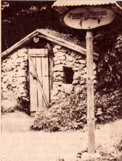
Földbevéjrt faszénégető kunyhó

A vadregényes környezetben ott látható az ómassai kétszemélyes, a répáshutai háromszemélyes és négy-