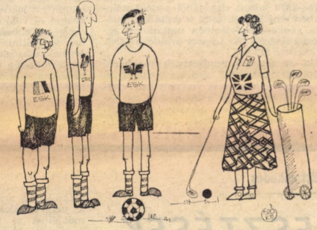
Thatcher: csak kisebb szabálymódosításra gondolok...

Anglia nemigen számíthat a tagországok és a Bizottság támogatására, mert szemükben az vizsgálják lenne az „európai egységhez” vezető út. Ok arra hitvatlanok, hogy a CAP jelenleg az EGK egyetlen jelentős közös politikája, és az