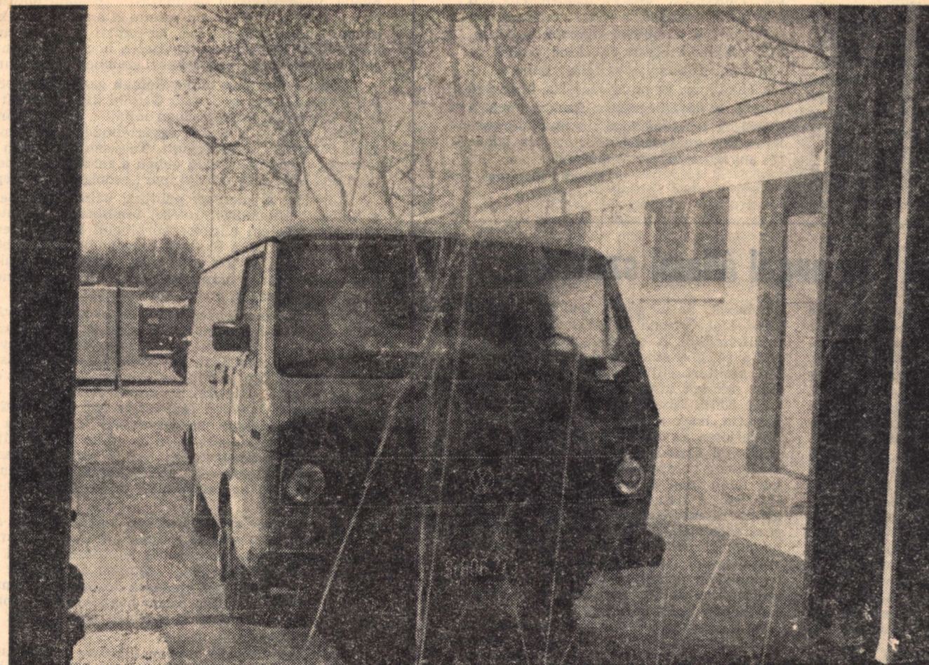
Gyártja: a Zsámbéki-Medence Mg. Tsz.

Járműmosó berendezéseinket külön megrendelői kívánságra vezérlőpulttal, felületkövető automatikával szállítjuk.