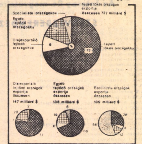
Az export megoszlása főbb országcsoportonként 1977-ben a GATT adatai alapján

Végül: határozatok születtek arról, hogy nem lehet fiktív vagy erőszakolt technológiai követelményeket állítani az importtermékek elé és ily módon csökkenteni azok versenyképességét a felvevő ország piacán.