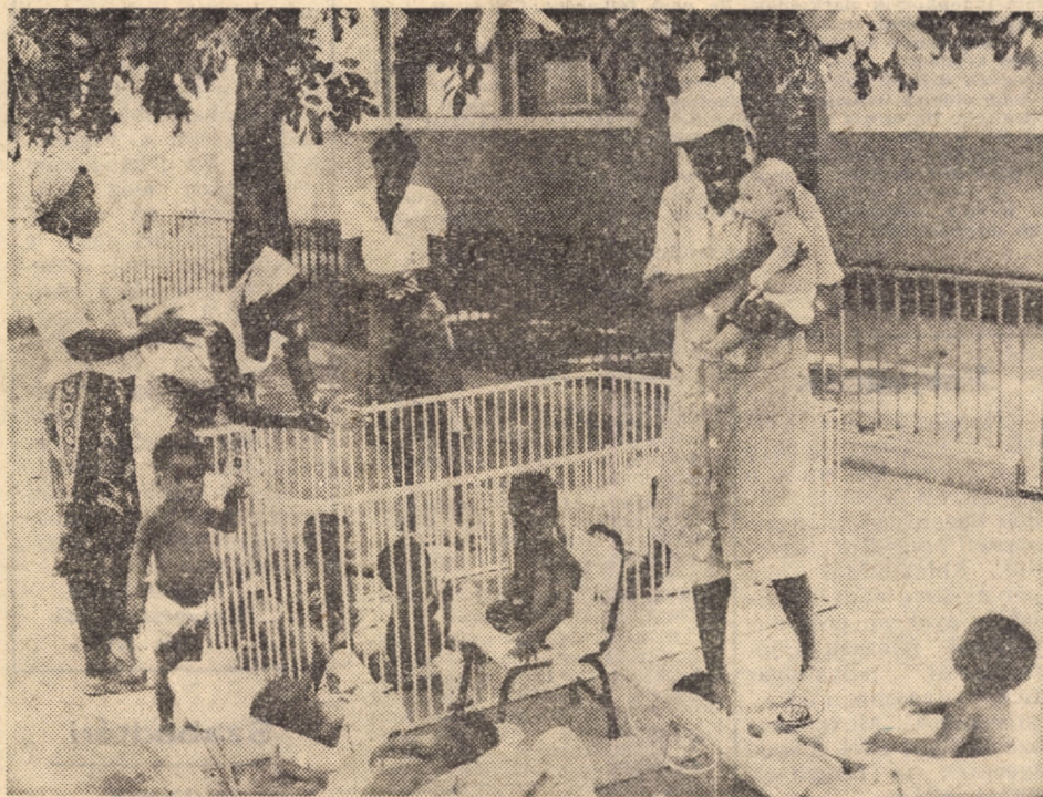
Tizenkét új óvoda épült a közelmúltban az angolai fővárosban. A sötét bőrű kicsikről egyre több szakképzett óvónő gondoskodik.