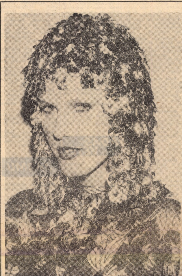
Alighanem ilyen árak mellett is lesz keletje Paco Rabanne öszi, „természetesen” aranyból készült, fejdíszkreatívájának...

A küldöttség több napot tartózkodik Moszkvában és találkozik az SZKP és a szovjet kormány magas rangú vezetőivel.