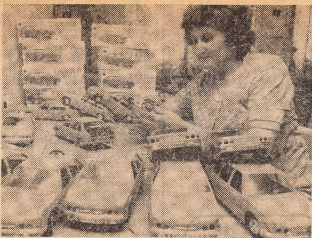
A dél-csehországi Trhové-Svinyben levő Koh-i-noor gyárban egymillió elektromos és mechanikus játékot készítenek. Képkönn a távirányítású Tatra 613-as játkautók utolsó ellenőrzése.