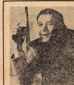
Színes magyar film.