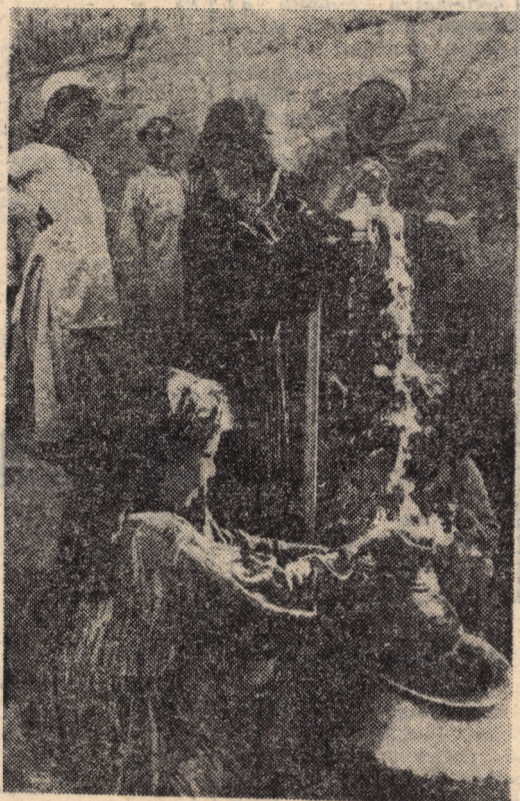
1979 a gyermekek éve. A képen: tiszta víz folyik a kútból egy afgán faluban. A vezetékét az Unicef, az ENSZ gyermekalapja építtette.