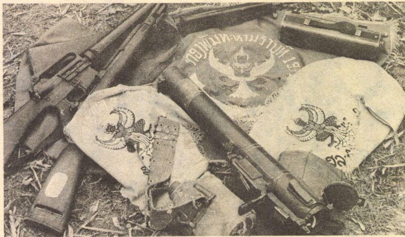
A FRONT ÁLTAL ZSÁKMÁNYOLT ZASZLÓK ÉS FEGYVEREK

Laosz területének kétharmad része a szabad övezet, amelyet a Laoszi Hazafias Front Pártja ellenőrzi. A Hazafias Front a felszabadított övezetben eredményesen fejleszti a mezőgazdaságot, az oktatási és egészségügyi hálózatot. Jelentős öntözőrendszert építettek ki és a parasztokat hozzászoktatták az évi kétszeri rizsaratáshoz. A hegyvidéki körzetben például a meőkat, akik erdőégetéssel rizsgazdálkodást űztek, megtanít-