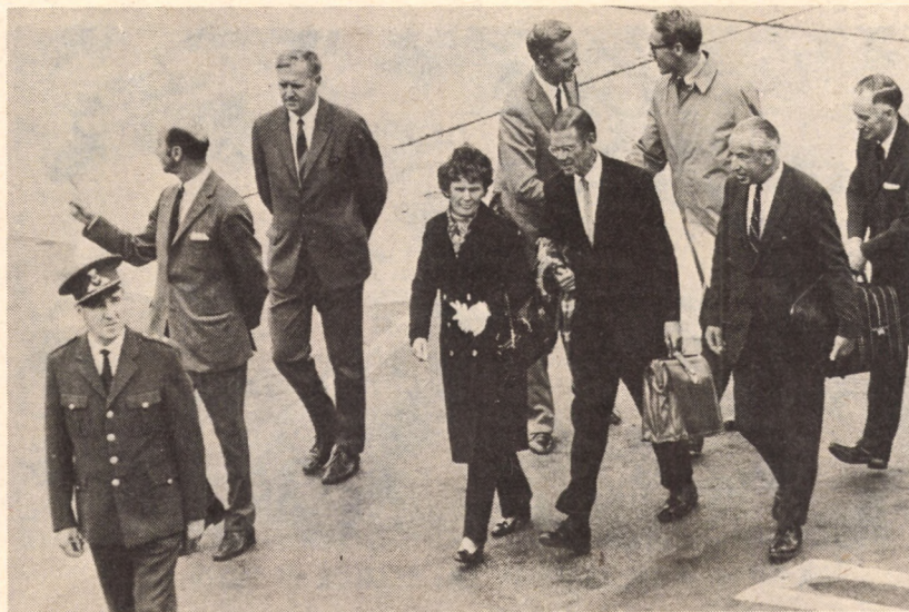
MCNAMARA ÉS FELESÉGE KOPPENHÁGA REPULÓTERÉN 14 év után vége szakad a paradicsomi életnek

Az Alap célja a hivatalos megfogalmazás szerint: megkönnyíteni a nemzetközi kereskedelem ki-egyensúlyozott növekedését, előmozdítani a devizaárfolyamok stabilitását, lehetővé tenni a tagállamoknak a fizetési mérlegükben mutatkozó zavarok kiküszöbölését, és ily módon biztosítani a foglalkoztatottság és realjövedelem magas színvonalát. Hogy elkerüljék az első világháború után jelentkező tömeges valutaleértékelést, rög-