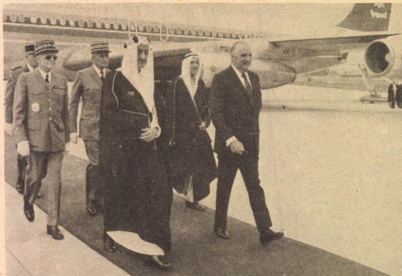
1973. MÁJUS, PÁRISZ: FEJSZÁL KIRÁLY POMPIDOU ELNÖKKEL Washington a maga zsebében akarja tudni az arzenál kulcsát

Még mindig az Egyesült Államoknál maradva: további nyilvánvaló kérdőjel az óriási politikai hatalommal és befolyással rendelkező nagy amerikai olajmonopóliumok magatartása. Január utolsó napjaiban a Jackson demokrata párti és Percy republikánus párti szenátor vezetése alatt álló vizsgálóbizottság összecsapott az olajmonopóliumok képviselőivel. A fellengzős szavak párbajából azonban mindeddig nem sok megfogható tény emelkedett ki — azon túlmenően, hogy a szenátusi bizottság elnöke és elnökhelyette-