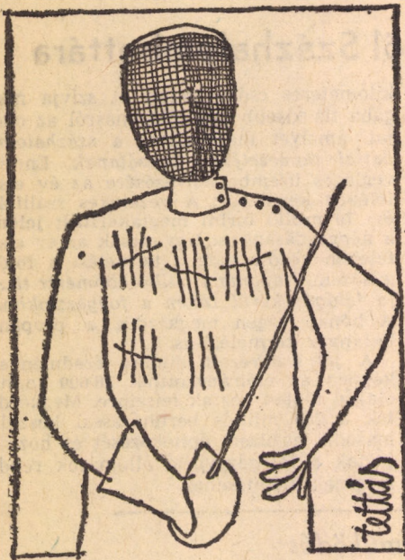
(Tettamanti Béla karikatúrája)