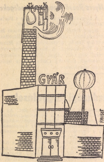
(Fauszt József karikatúrája)